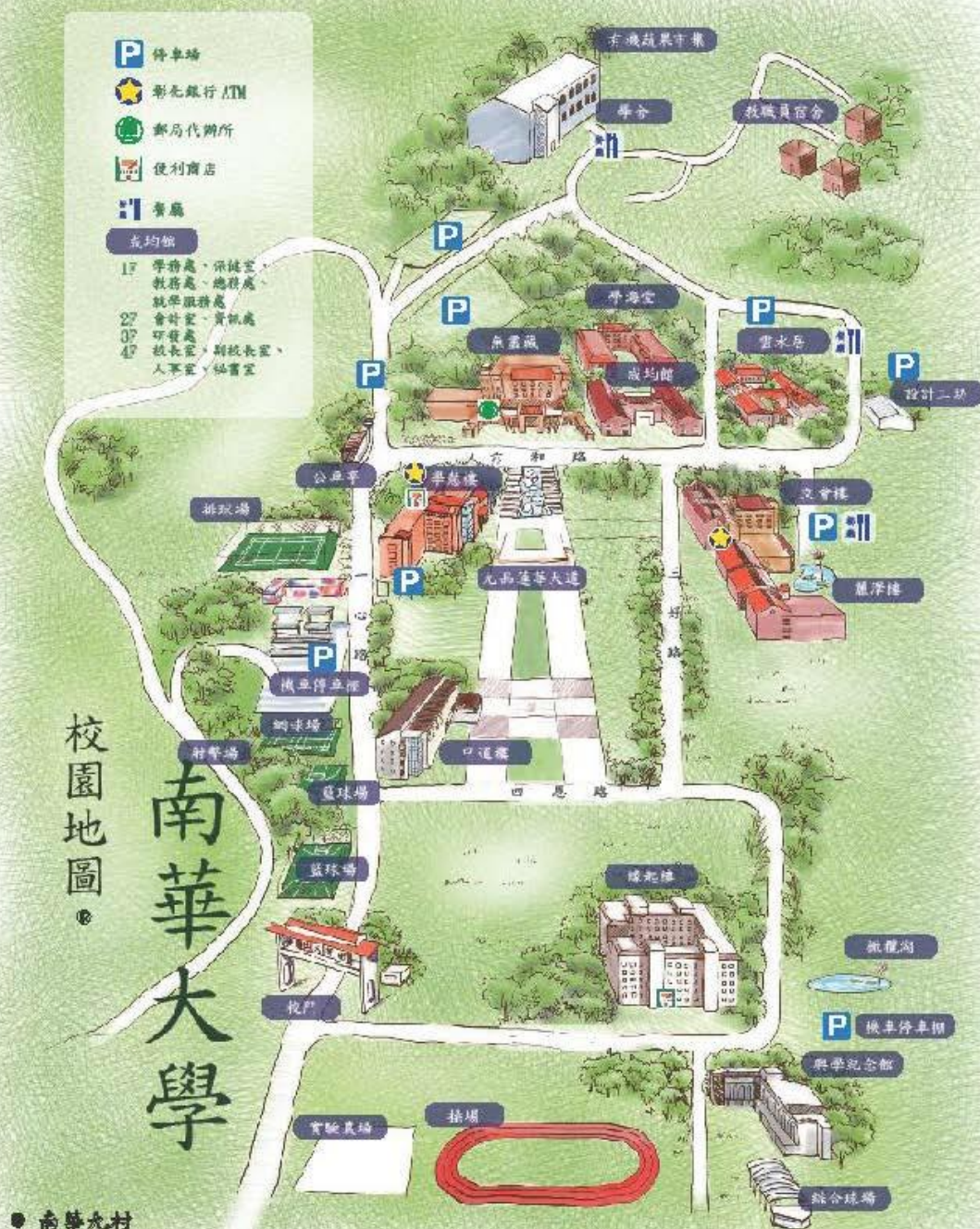
南華大學校園地圖